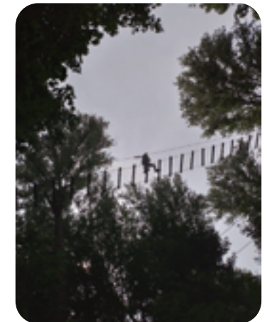
Ausflug mit den Jugendlichen in den Hochseilgarten